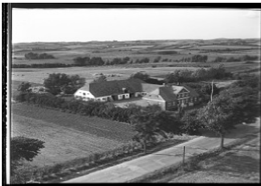
Linien 23, Haarby