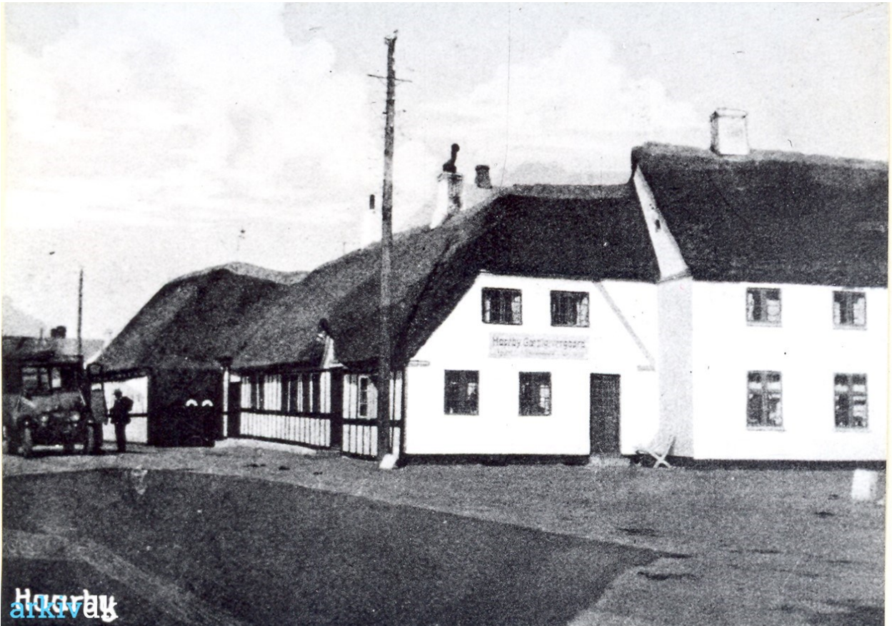
Billedet er fra 1900-1910 Haarby Gæstgivergaard – står der på gavlen

Ikke mange kroer kan føres så langt tilbage som Haarby Kro, der har ligget på samme sted i mere end 300 år. I gamle retsprotokoller omtales den allerede i 1500-tallet. Men dens data regnes fra omkring 1659, hvor den bliver Kgl. Privilegeret Kro. Kroen bestod på det tidspunkt af bindingsværk med stråtag og tilhørende rejsestald samt en mindre købmandsbutik/landhandel, som var forpagtet ud. Da diligencens rute gik fra Faaborg til Assens, var det naturligt, at mellemstationen blev Haarby Kro.